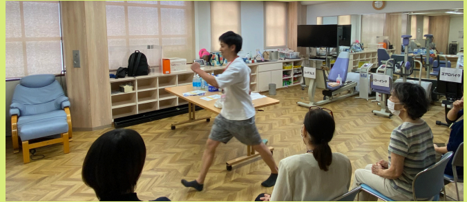
昨年の活動の様子

当日は医師・看護師・薬剤師・健康運動指導士・管理栄養士など様々なメンバーがお待ちしております。相談・雑談にお越しくたださるだけでもO.K. たくさんのご来場をお待ちしております。